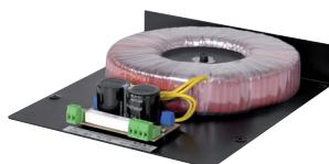
PA-T 400 100 V-Übertrager